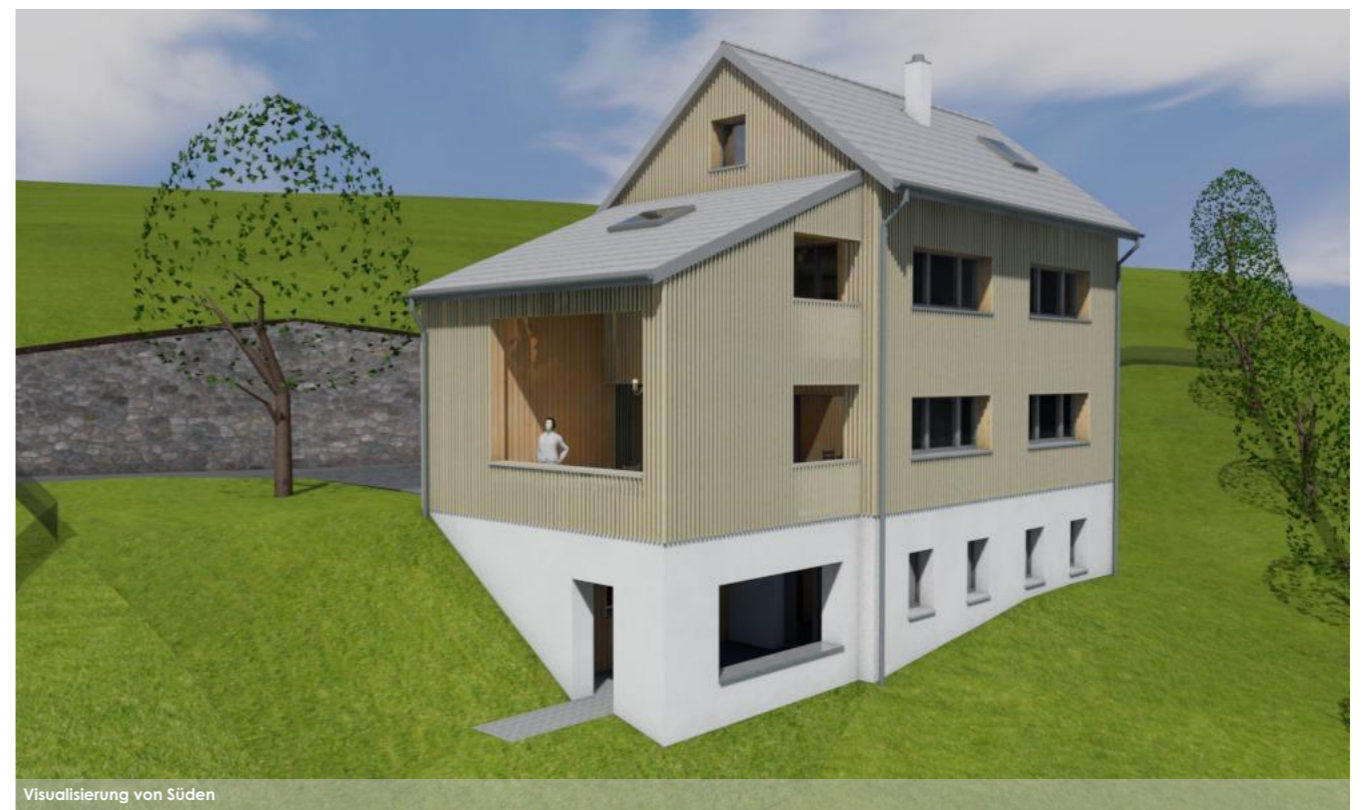
Visualisierung von Süden