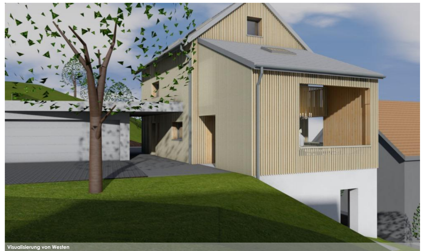
Visualisierung von Westen